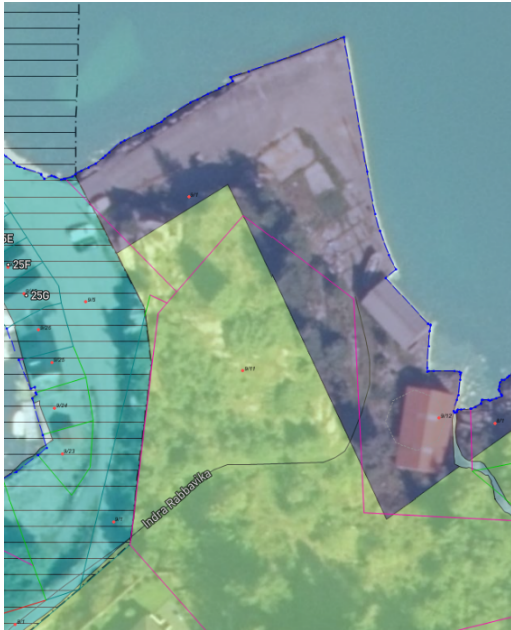
Figur 3 Utklipp frå gjeldande arealplankart