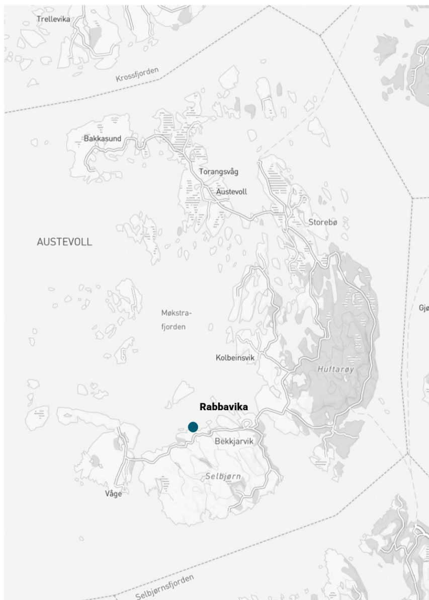
Figur 1 Oversiktskart som viser planområdets plassering