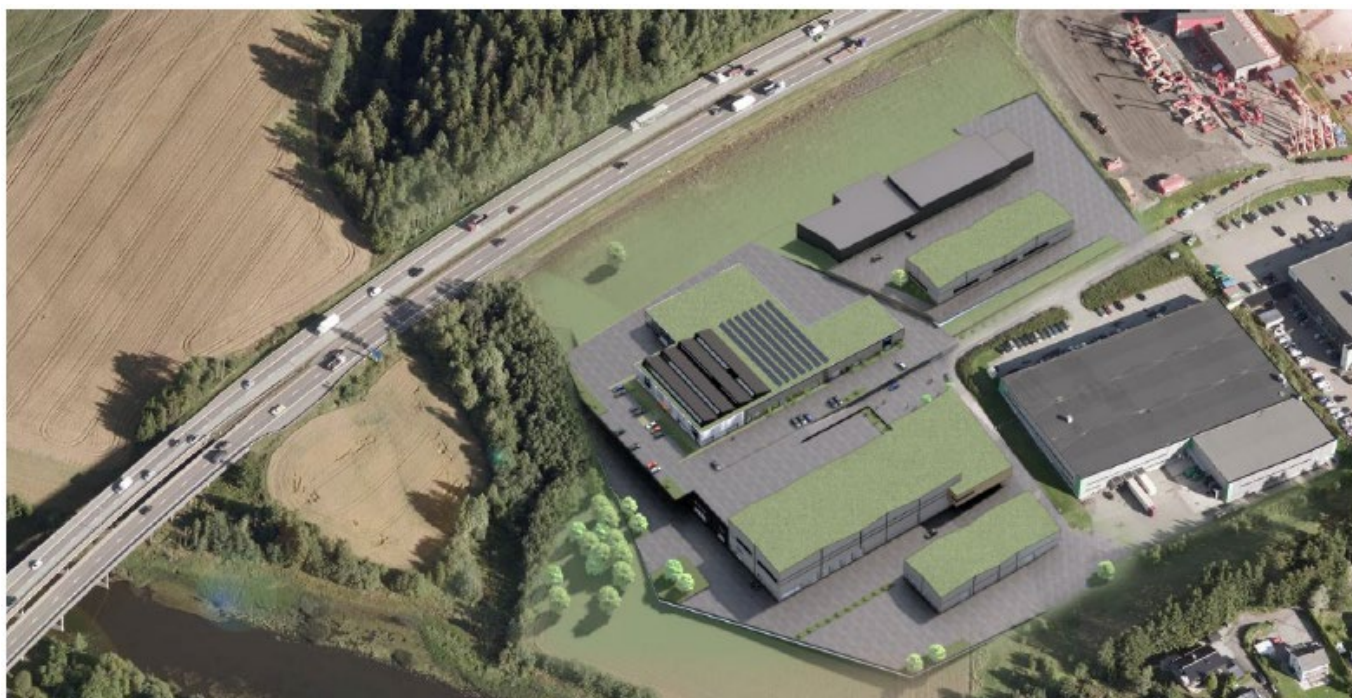
Figur 2: Utklipp fra planinitiativ, s. 7. Foreslått bebyggelse sett fra fugleperspektiv.