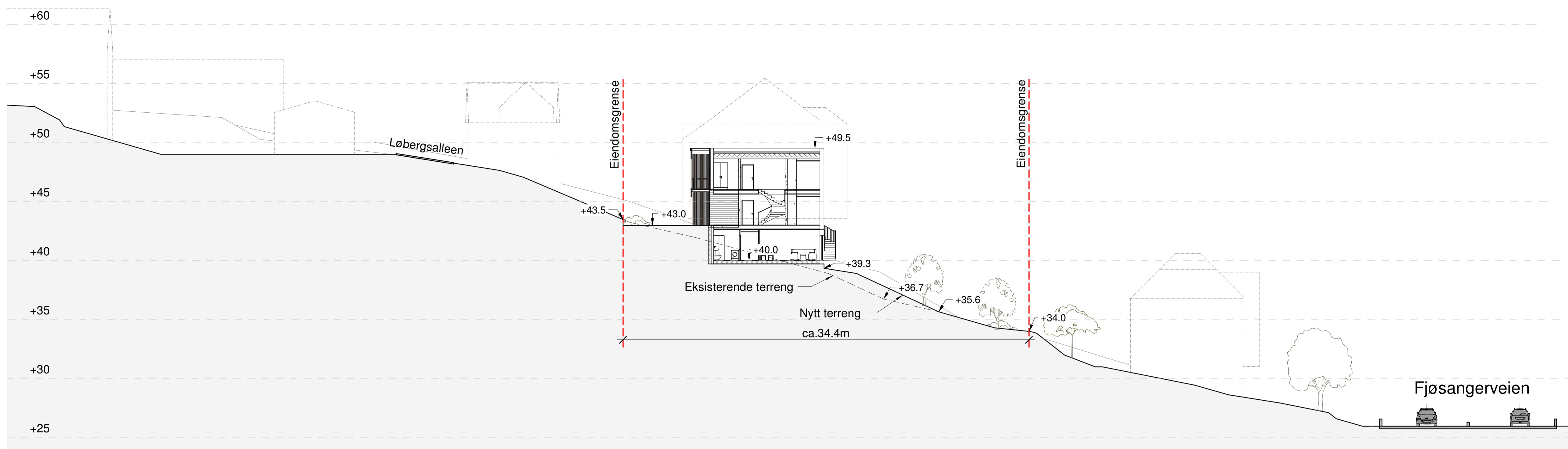
Terrengprofil 1-1 1 : 200