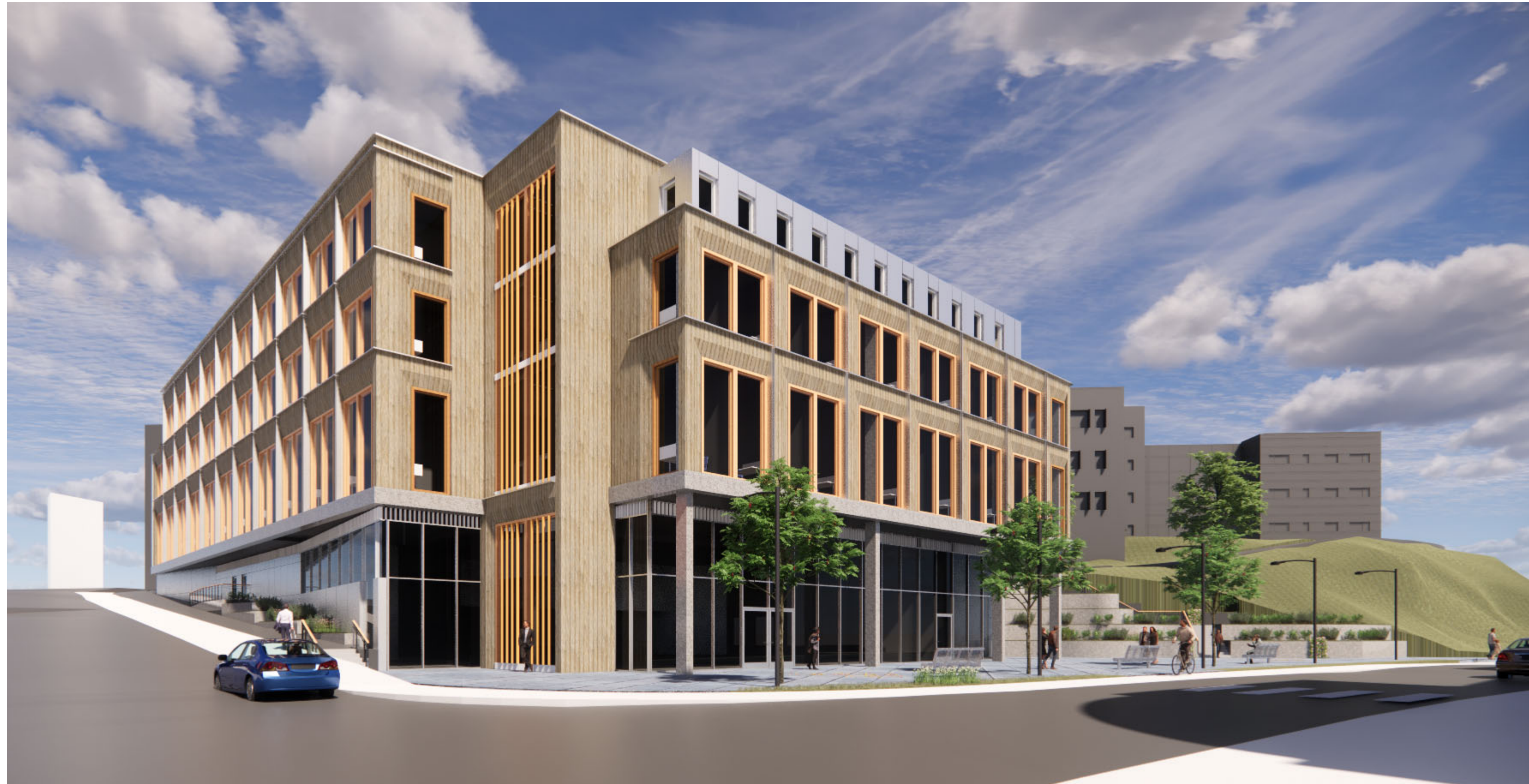
Tilbygg sett fra sør ved fremtidig gågate