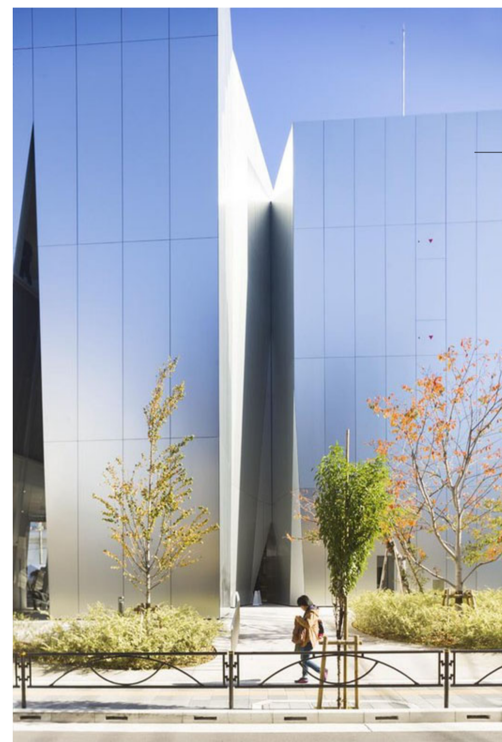
Metallkledning - tilbaketrunkne fasader