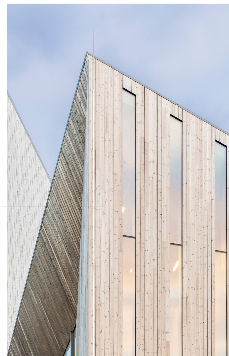
Trekledning - hovedvolum

Det er foreslått utstrakt bruk av tre i byggets fasader, med innslag av metallkledning for deler av bygget som er trukket tilbake fra hovedvolumet. En menneskelig skala kommer til uttrykk i fasaden gjennom oppdelte vindusflater og fasademessig detaljering.