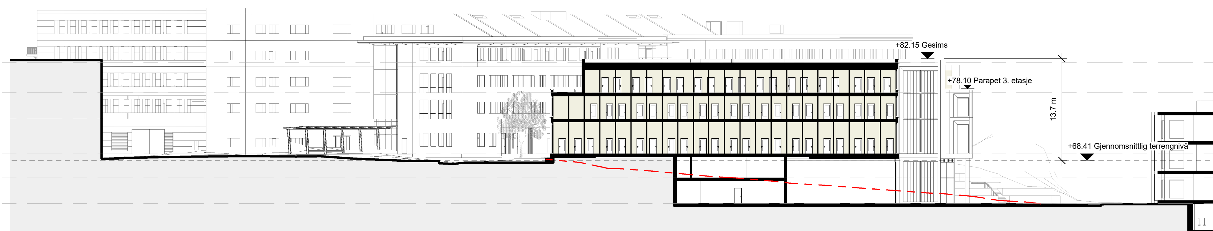
Terrenprofil B-B 1 : 300