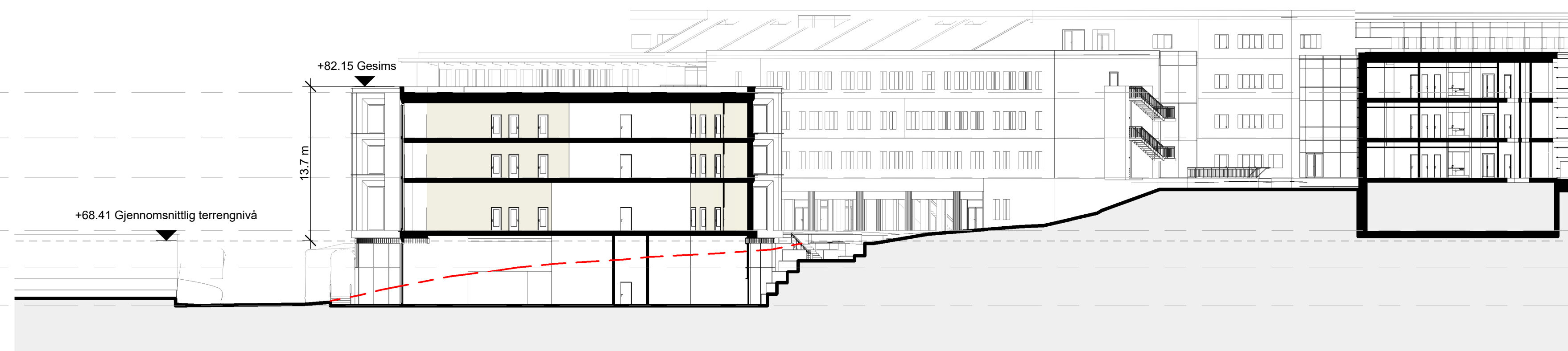
Terrenprofil A-A 1 : 300